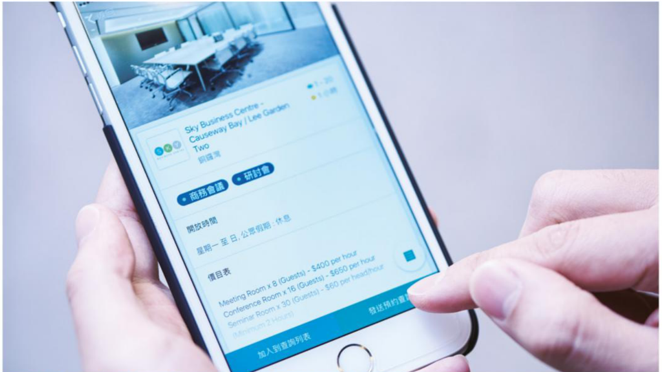
2book 諧音為「易 book」，顧名思義協助用戶方便快捷地預訂各式活動場地，亦為聚會地點及活動內容提供建議。